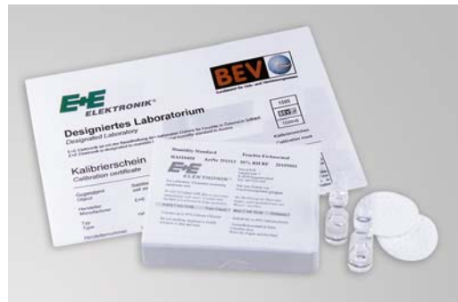
Feuchtekalibrierlösung mit Zertifikat

Feuchtemessumformer wie auch alle anderen Messinstrumente sollen regelmäßig überprüft und wenn nötig justiert werden.