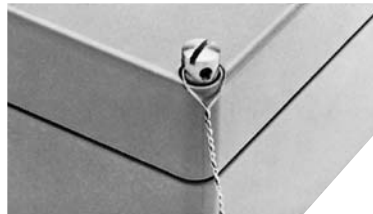
Tornillos de la tapa precintables