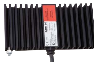
HSF 50/HSF 100