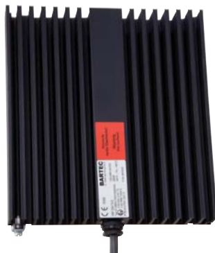
HSF 120/HSF 200