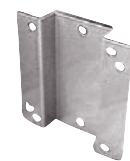
WB Стенная крепежная консоль

Материал: силикон Термостойкость: -55 °C ... +180 °C