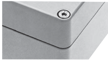
Болт с внутренним шестигранным шлицем

Материал: никелированная латунь, 10 x 3 (5) мм