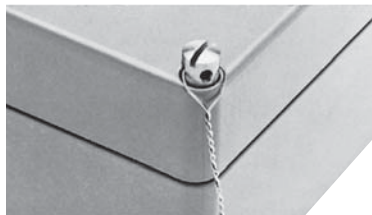
Пломбируемые винты для крышки