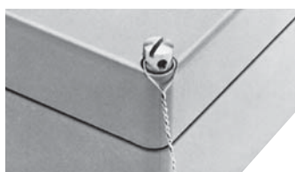
Vis de couvercle plombable