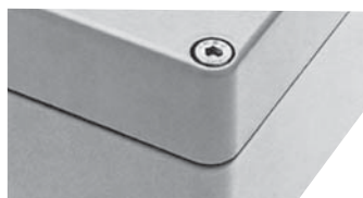
Vis six pans creux

BARTEC livre selon votre souhait tous les coffrets avec équipement complet, bornes, entrées de câbles, obturateurs, charnières externes ainsi que tout autre composant.