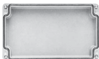
Joint de couvercle

Tôle d'acier zinguée stratifié moulé DIN 7735 HP 2061 pour coffret polyester 80 x 75 à 190 x 75